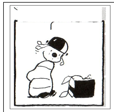
Stagnazione e fallimento vocazionale

Egli non potrà crescere nell'auto-trascendenza né vi può essere modo di aiutarlo.