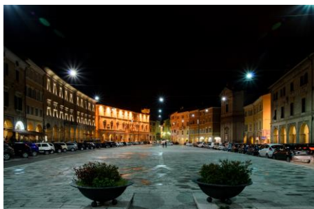
San Severino Marche (MC)

Macerata, San Severino Marche, Camerino, Monastero di Fonte Avellana