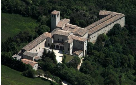
Monastero Camaldolese di Fonte Avellana (PU)

3° giorno, venerdì 6 aprile: Fonte Avellana, Grotte di Frasassi, Padova