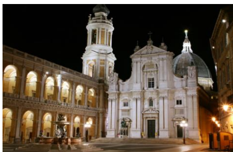
Santuario della Santa Casa di Loreto (AN)

Padova, Loreto, Abbazia di Chiaravalle di Fiastra, Macerata